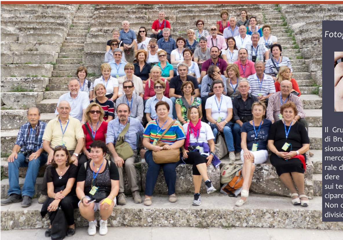
I nostri amici provano l'acustica del teatro di Epidauro. Anche lo stropiccio di un foglio di carta può essere ascoltato in ogni parte del teatro.

Il Gruppo fotografi amatoriali di Brusaporto, invita gli appassionati interessati a ritrovarsi al mercoledì sera al Centro culturale di Brusaporto, per condividere esperienze, confrontarsi sui temi della fotografia, partecipare ad iniziative comuni. Non ci sono obblighi, solo condivisione di una passione.