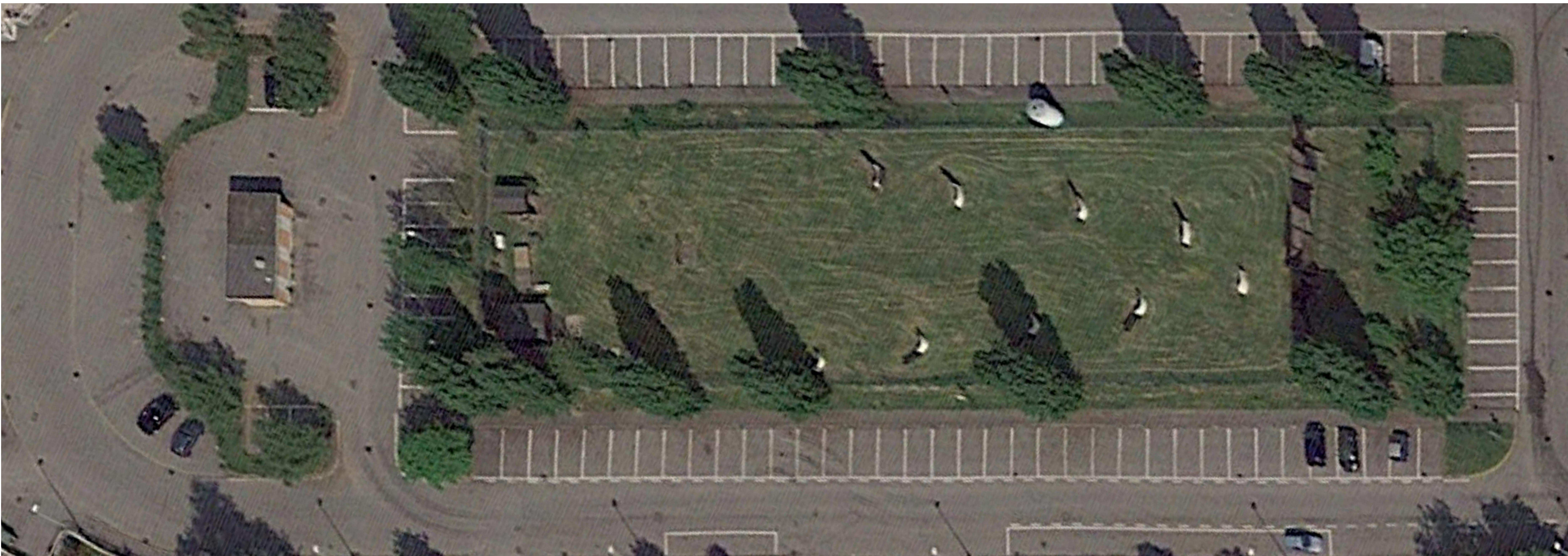
ORTOFOTO scala 1:200

VARIANTE N.2 AL PIANO ATTUATIVO DENOMINATO "CANTALUPA" DI CUI ALLE CONVENZIONI STIPULATE IN DATA 18 DICEMBRE 2000 E 3 APRILE 2003